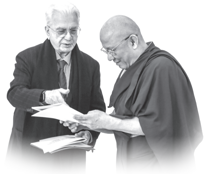
Михаил Борисович Пиотровский Директор Государственного Эрмитажа